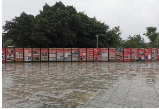
四川大学江安校区展区