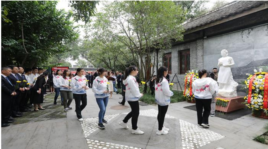
与会领导和师生代表依次向江竹筠烈士献花