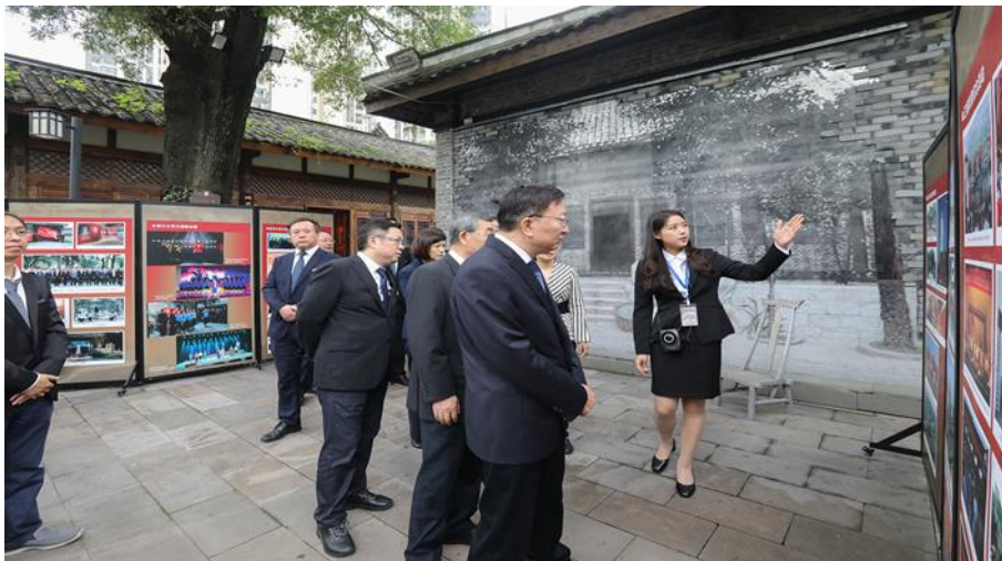
献花仪式结束后，参加活动的领导和师生有序参观江竹筠烈士纪念展

四川大学历来是四川进步势力的大本营和西南一带传播革命种子的园地，自诞生之日起，就在血与火的洗礼中涌现了一大批与时代和人民同呼吸、共命运的仁人志士。他们的爱国情、报国志，铸就了四川大学光荣的革命传统和深厚的红色基因，红色文化与爱国奉献成为川大校园文化的核心基因。