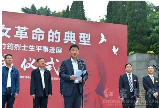
重庆红岩博物馆展区