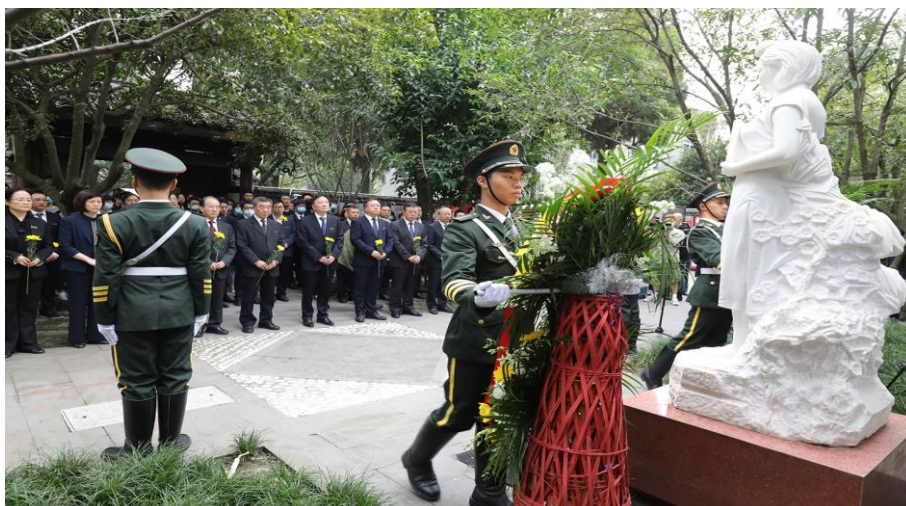
国旗班学生向革命英烈敬献花篮