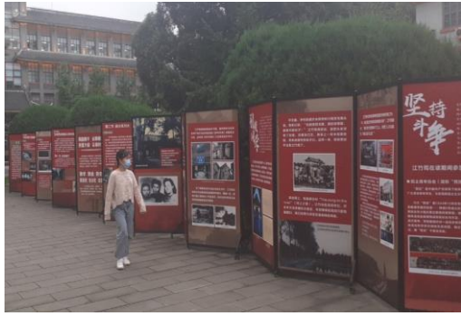
四川大学华西校区展区