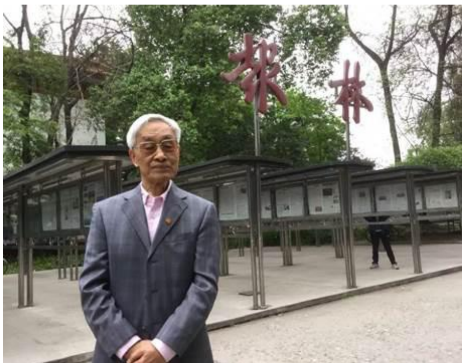
“报林之父”心系“报林”

当年常去那里看报，“报林”是师生们了解时事、交流信息的场所，也是评论时政的乐土。