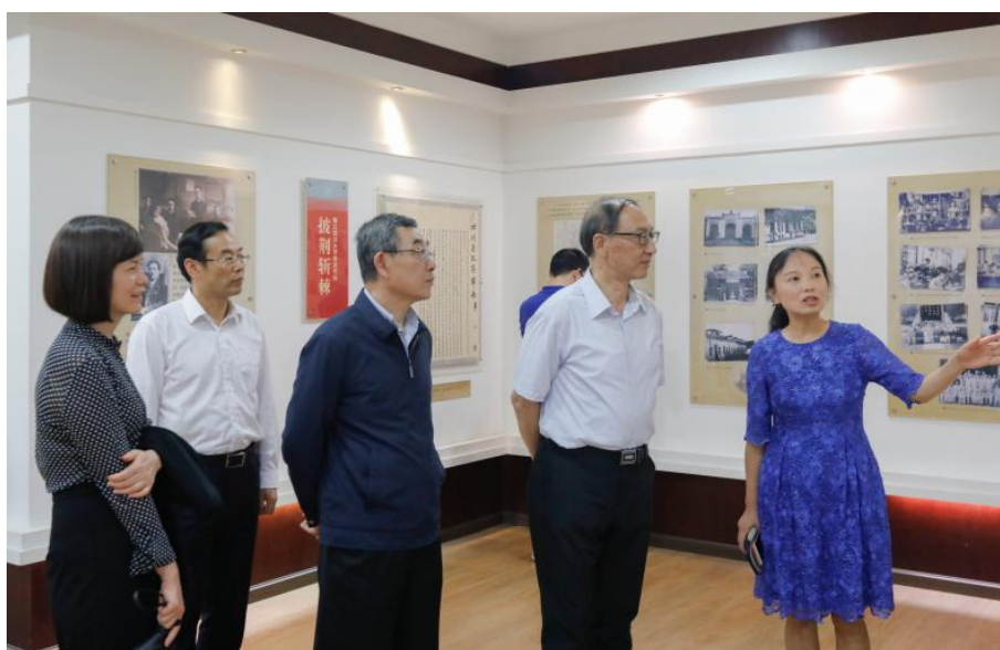
毕玉馆长接待领导参观

2019 年 4、5 月，四川大学校史展览馆、江姐馆先后接待了后勤集团、树德外国语学校、电气信息学院、商学院、华西公卫、文新学院、中国人民银行、学工部、进出口银行、乐山更新中学、材料学院、艺术学院、四川省地方志编委、眉山贯城中学、科产集团、经济学院、制造学院、化工学院、化学学院、成教学院、川大附小、汉中中学、国际关系学院、计算机学院、历史文化学院、软件学院、小金中学、口腔学院、药学院、团委、教务处、高分子学院、建环学院、人事处、公共管理学院、设备处、温江中学、西北工业大学、中联办人事部、农业银行、港澳台办、物理学院、科研院、中国石化等 5001 人/次参观。