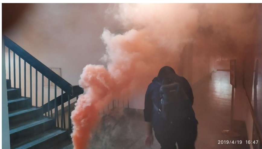
模拟火灾逃生疏散演练