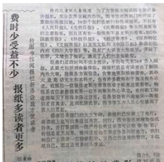
80年代的《四川大学报》报道“报林”