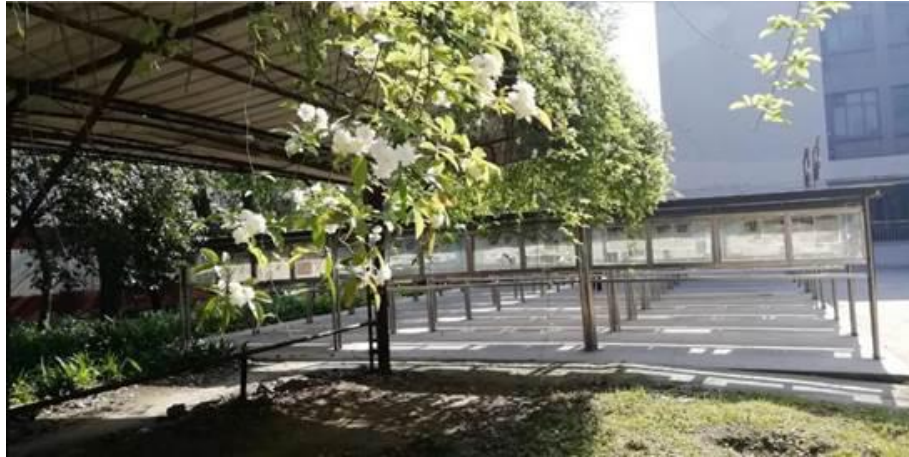
春日暖阳下的“报林”

那年头散步时，常爱带着小女去“报林”溜达一圈，真是有那种“孩童在报林嬉戏玩耍”场景。我呢，得以悠闲自在浏览。还记得，当时最感兴趣的是《成都晚报·副刊》、《文摘》、《参考消息》……“假巴意思”学了几天中文，爱看些与文艺沾边的新闻。每到春天报林旁的玉兰花怒放，让人感觉很美，但报林夏天的蚊子咬得人跳，数九寒天夜晚读报是要毅力的。……如今想起，还是蛮有意思的。