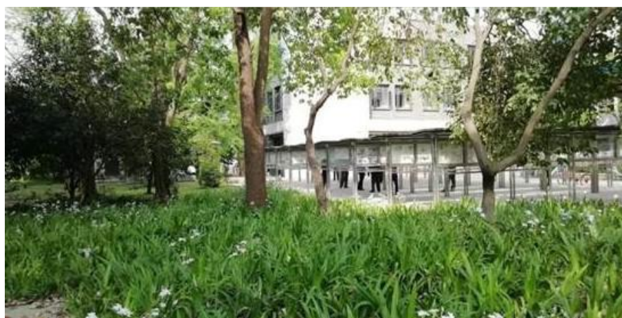
春天的“报林”草长莺飞