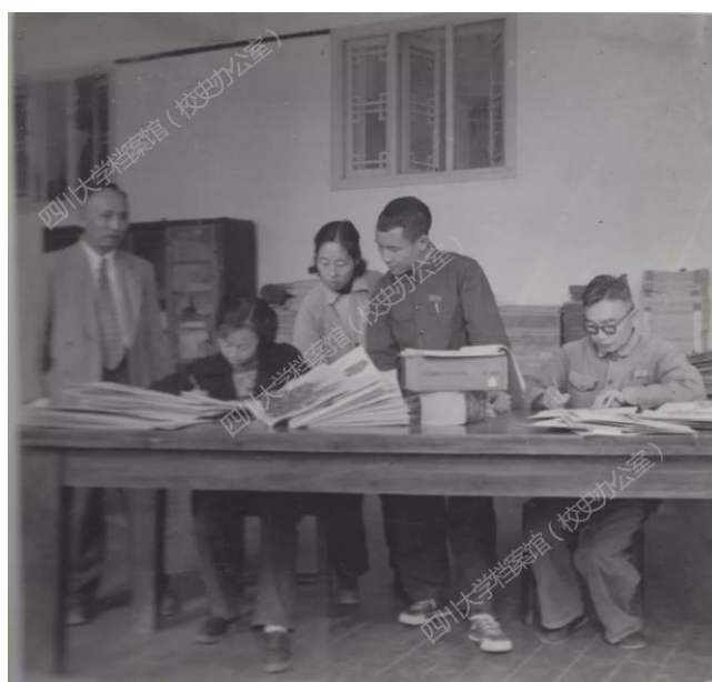
方文培教授（左一）在指导学生进行植物分类研究

上世纪 30 年代，方文培留学英伦，在以研究植物尤其是杜鹃花科闻名于世的爱丁堡大学获博士学位。当时，他的学习室是一间小木板房，被人称为“中国木板房”。案头的杜鹃花标本，多数产自中国，这让方文培时常会有思乡的愁绪。于是，他将唐诗换了二字，来寄托心情：“蜀国曾闻子规鸟，英伦（原诗为宣城）还见杜鹃花，一叫一回肠一断，三春三月忆三巴。”1985 年，国际杜鹃花学会在美国西雅图召开学术会，会议开始，主席首先宣布：“请大家为去世的对杜鹃花研究作出重大贡献的方文培教授默哀。”